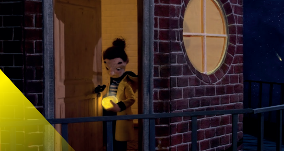
Meteoritenfischen, compétition 2