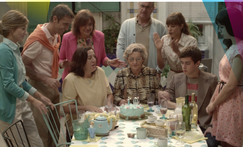
Y otro año perdices, compétition 3

12h30-13h30 Ciné-sandwich P'tit Quinquin, épisode 3. Gratuit. TAP théâtre. (p.4)