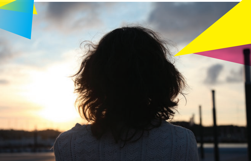
La Vida Después , compétition 11

12h30-13h30 Ciné-sandwich. P'tit Quinquin , épisode 4. Gratuit. TAP théâtre. (p.4)