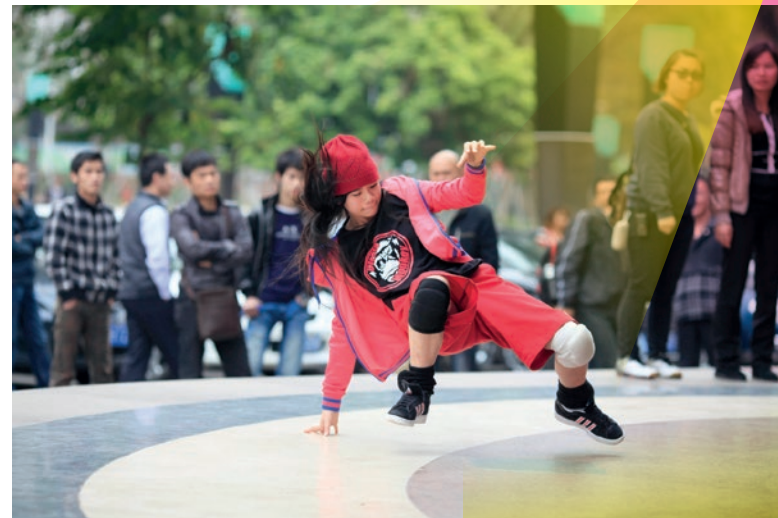
Circle Monkey, courts Hong Kong 1

Dans le droit fil de la saison extrême-orientale du TAP, cette édition met à l'honneur le cinéma d'expression chinoise avec six écoles de Pékin, Shanghai, Hong Kong et Taipei. Plus que la situation géopolitique, c'est le cinéma qui s'exprimera dans sa diversité et sa richesse.