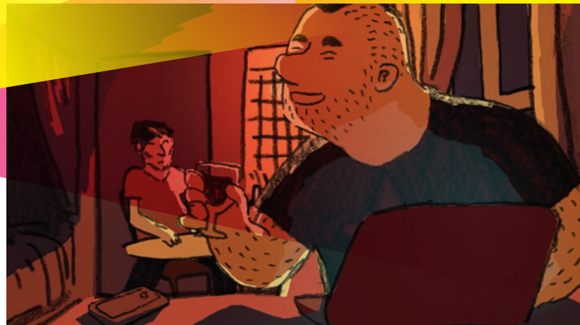
Je repasserai dans la semaine

21h-22h30 Compétition 11 + RENCONTRE TAP Castille