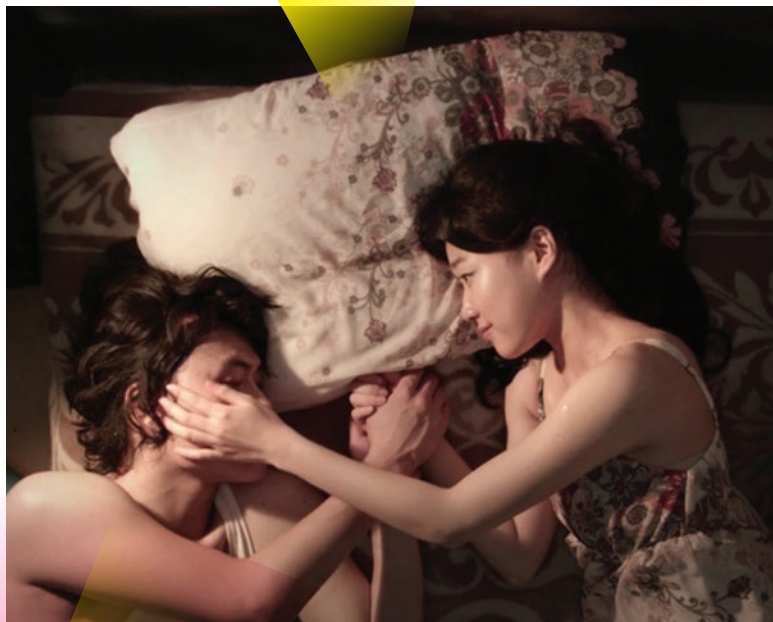
Mould, compétition 9

14h-15h30 Reprise du Palmarès, programme 1 TAP Castille