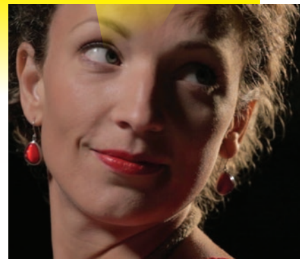
C'est que du bonheur , courts d'ici