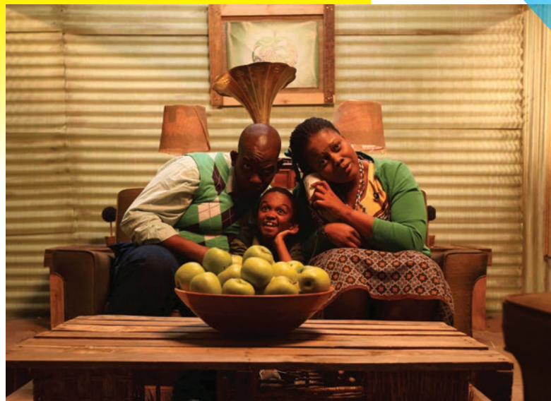
Kanyekanye , compétition 7

12h30-13h30 Ciné-sandwich. P'tit Quinquin , épisode 2. Gratuit. TAP théâtre. (p.4)