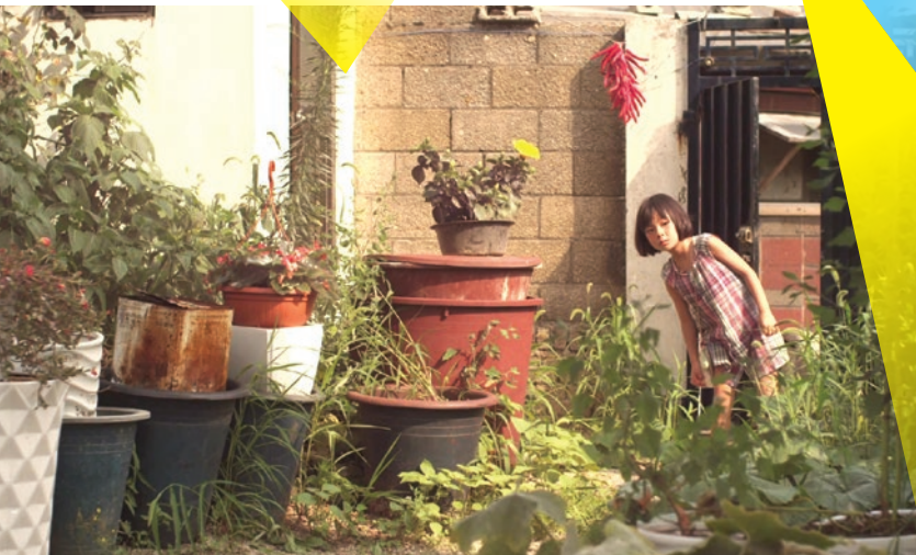
Sprout , compétition 12