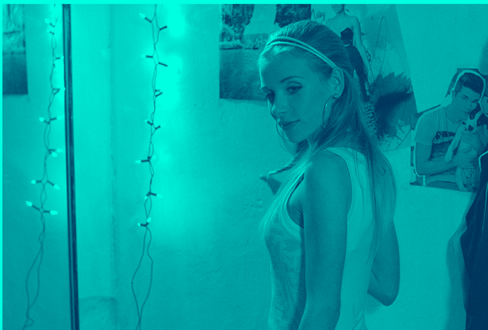
Aussi belle que toi, courts d'Allemagne 4