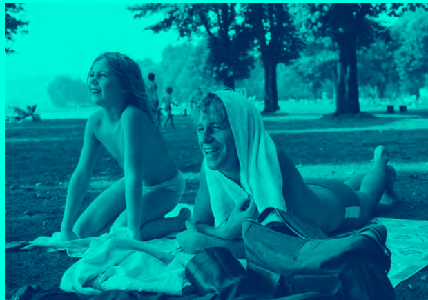
Alice dans les villes

Suivi d'une rencontre avec Rüdiger Vogler 20h30 – 22h20 | TAP théâtre