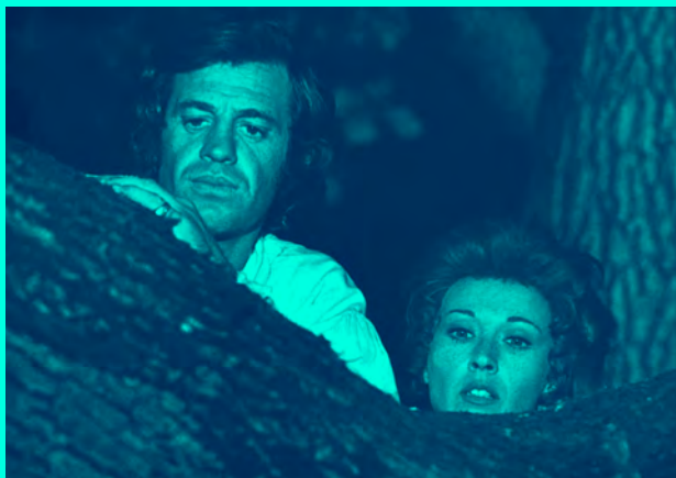
Les Mariés de l'an deux