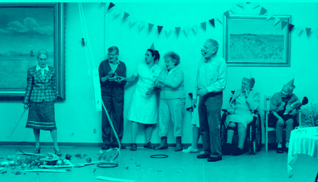
Goodnight Birdy , compétition 3

14h30–16h L'Irréparable Lars-Gunnar Lotz TAP Castille