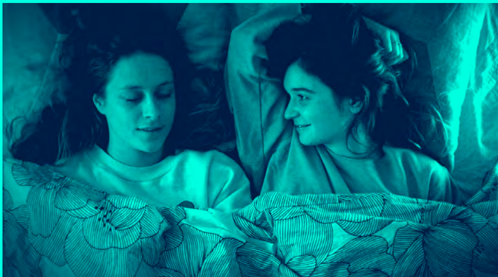
Une sur trois