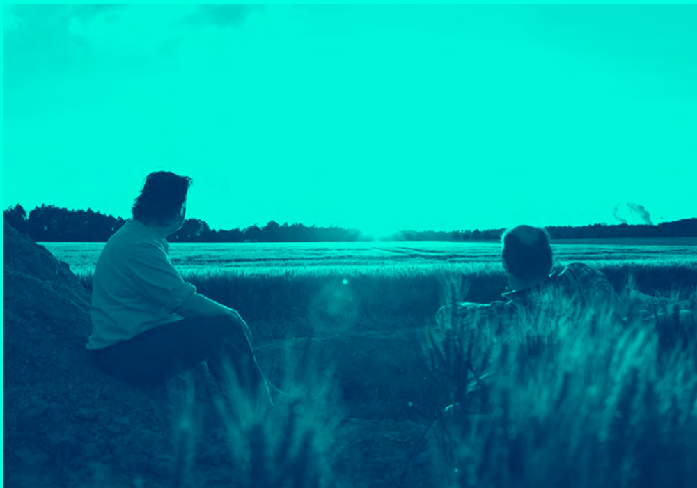
Ein Stein, courts d'Allemagne 3