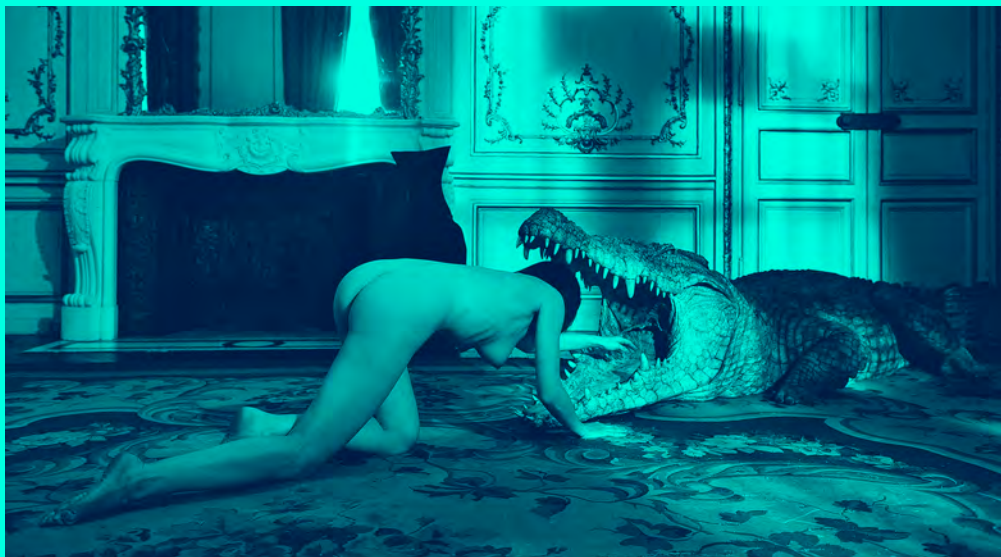
L'Exercice de l'État