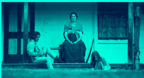
El pasado roto , compétition 11 | Let's Burn Something on My Way Out! , compétition 7 | Deux amis , Piou-piou, compétition 3 | Foal , compétition 8

16h – 17h30 Compétition 11 + rencontre TAP Castille