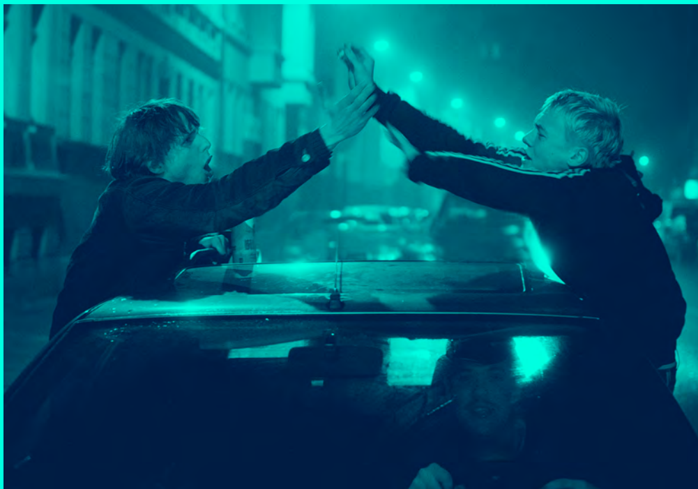
Le Temps des rêves