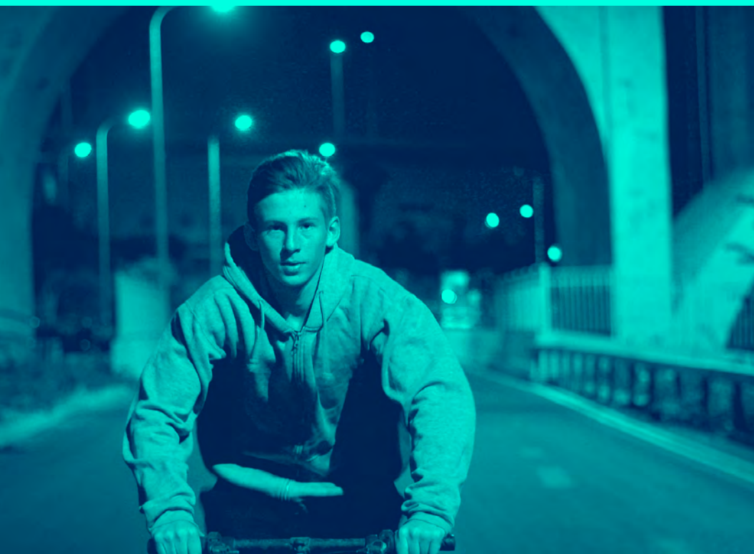
Ten Buildings Away, compétition 4

12h30 – 13h20 Ciné-sandwich : Karambolage Claire Doutriaux (p. 3) Gratuit TAP théâtre