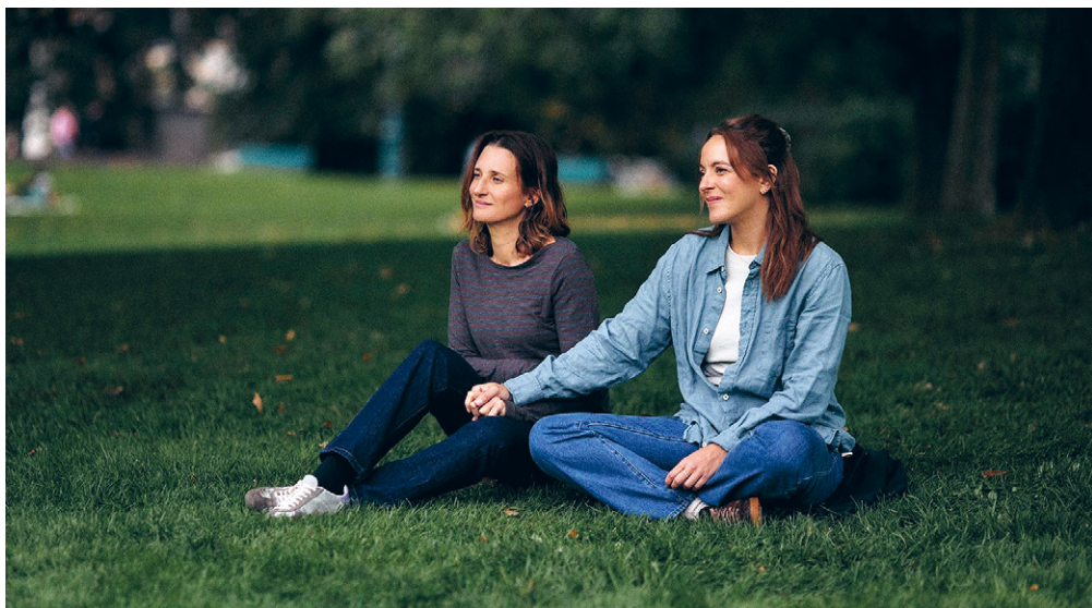
Les enfants vont bien

Martin Jauvat / Fiction / France / 2025 / 1h34 avec Martin Jauvat, Emmanuelle Bercot, William Lebghil